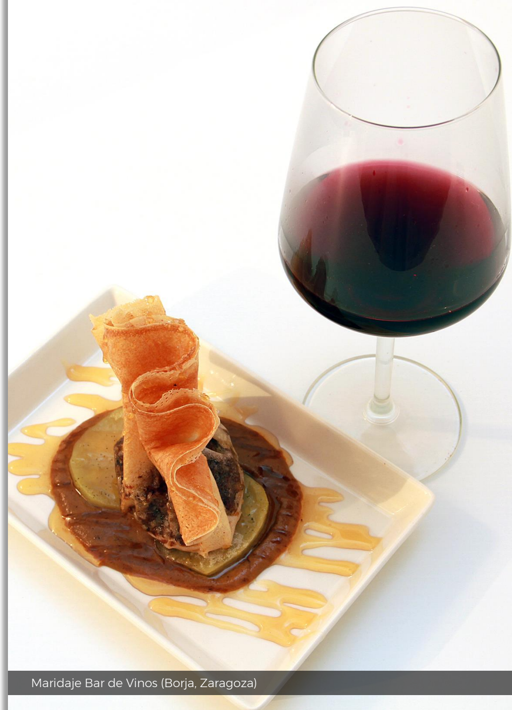
Maridaje Bar de Vinos (Borja, Zaragoza)