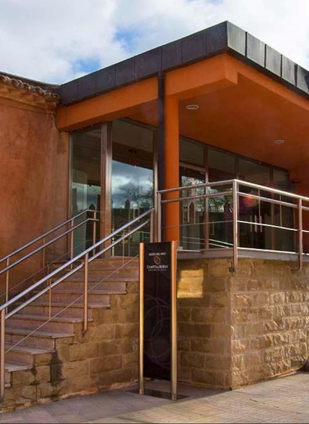
Museo del Vino de la D.O. Campo de Borja (Ainzón, Zaragoza)