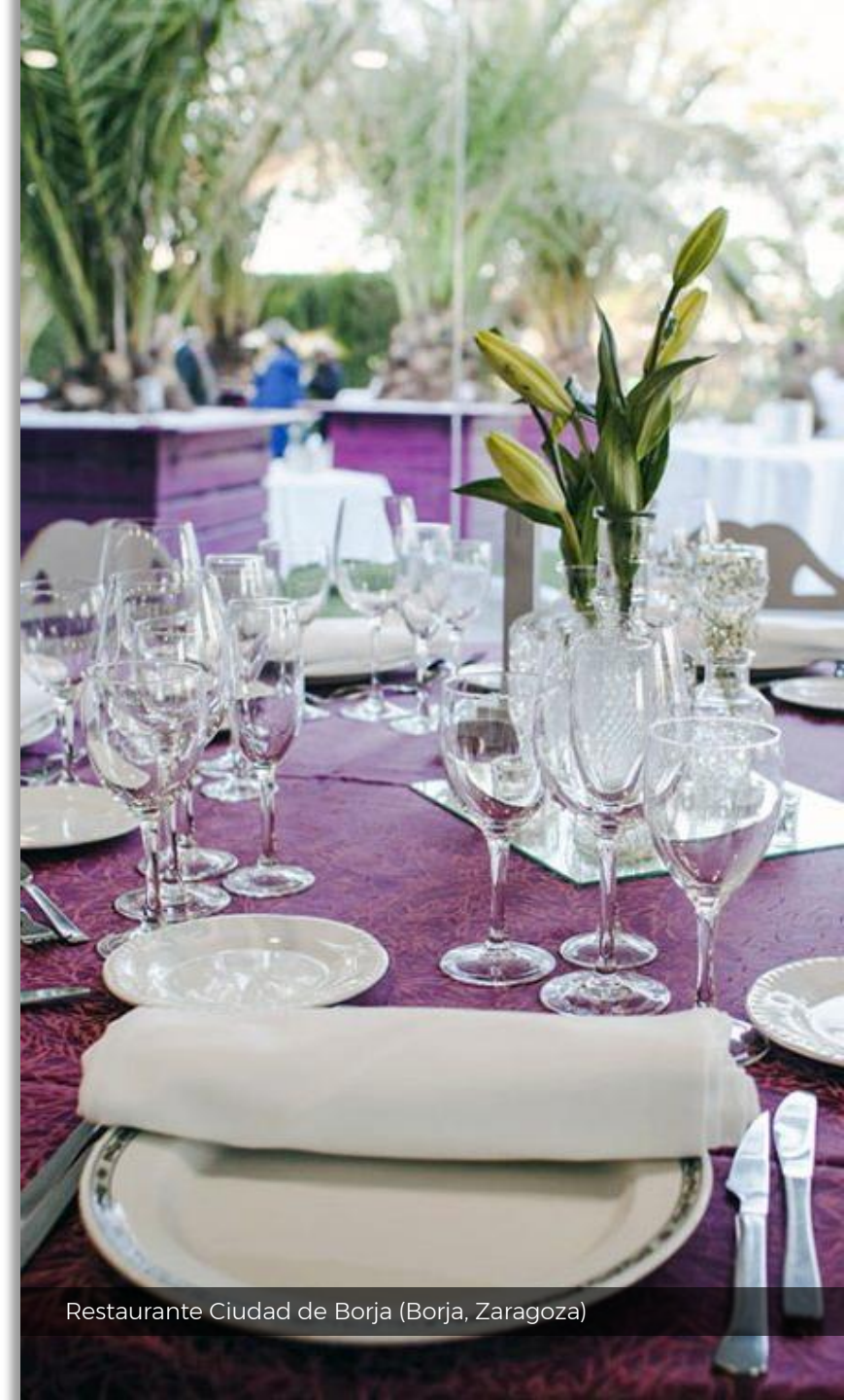
Restaurante Ciudad de Borja (Borja, Zaragoza)