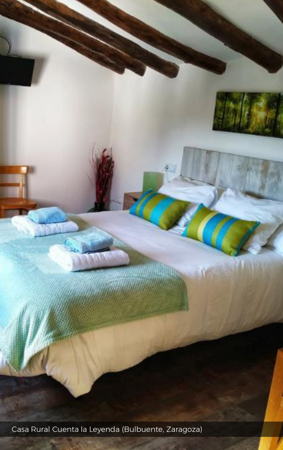
Casa Rural Cuenta la Leyenda (Bulbunte, Zaragoza)