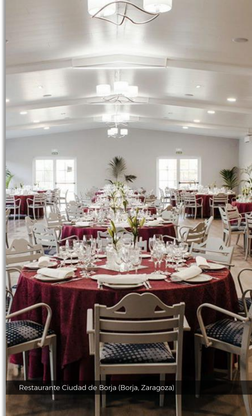
Restaurante Ciudad de Borja (Borja, Zaragoza)