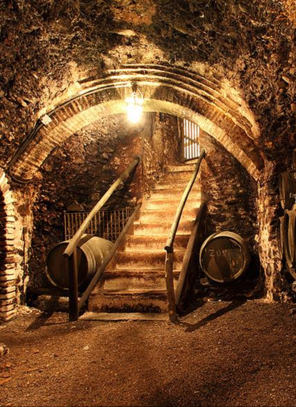
Bodegas Bordejé (Ainzón, Zaragoza)