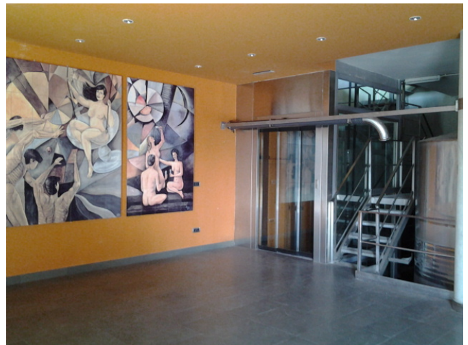
Rellano ascensor y escalera