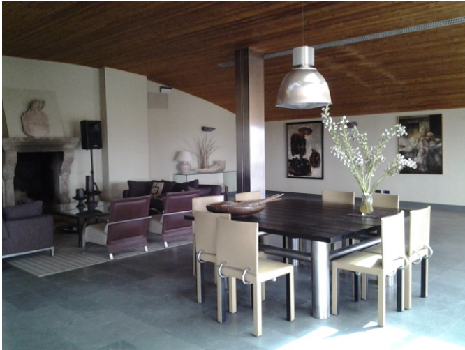
Sala de catas