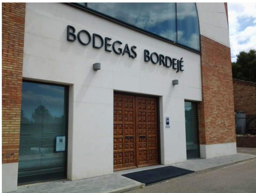
Fachada y acceso principal