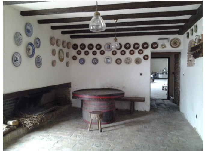
Vestíbulo entre zona de embotellado y sala de barricas