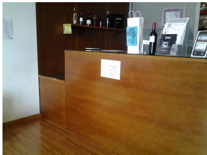
Mostrador de recepción