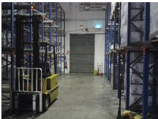
Zona de embalaje