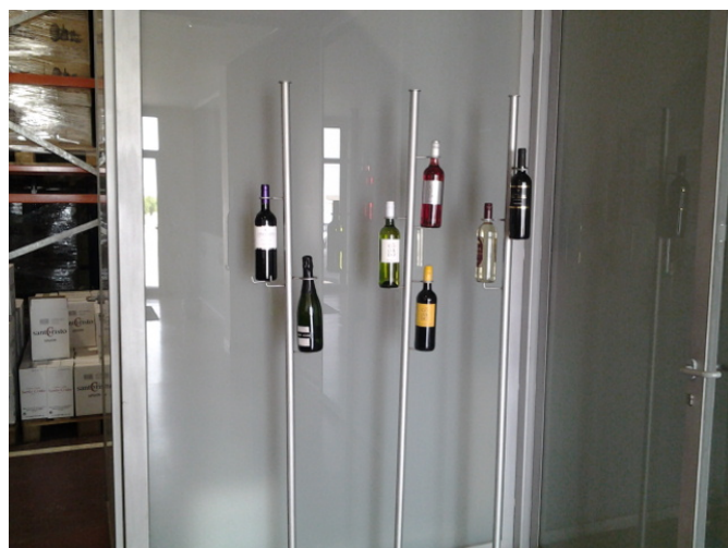
Expositor de botellas