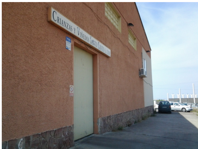
Entrada alternativa accesible