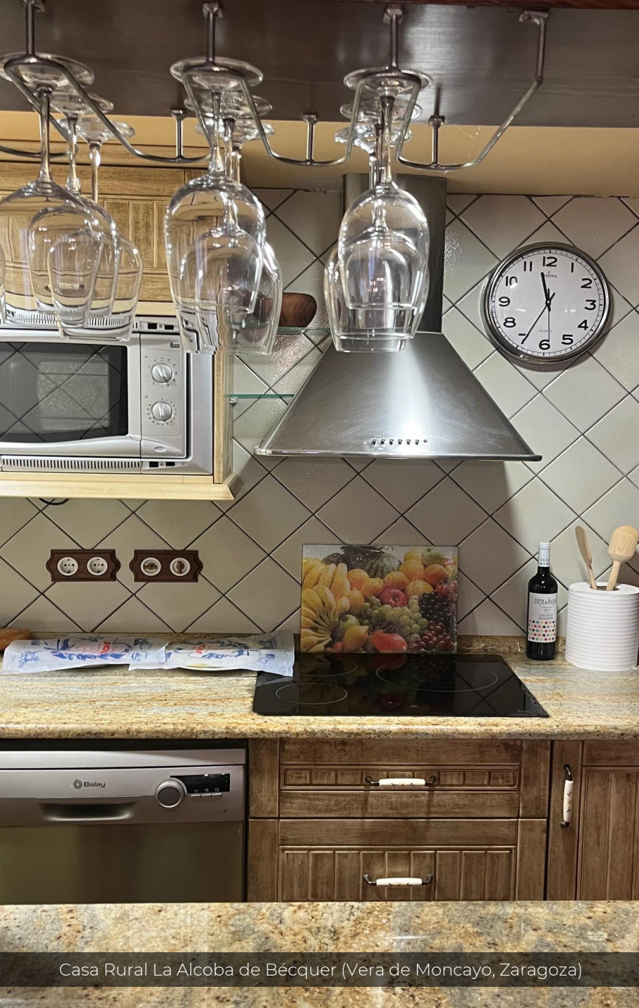
Casa Rural La Alcoba de Bécquer (Vera de Moncayo, Zaragoza)