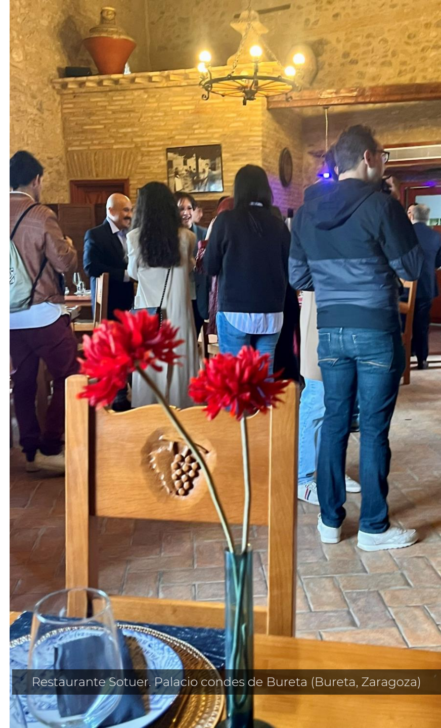
Restaurante Sotuer. Palacio condes de Bureta (Bureta, Zaragoza)