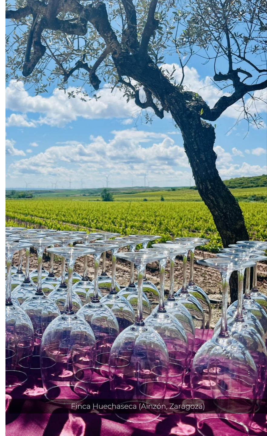
Finca Huechaseca (Ainzón, Zaragoza)