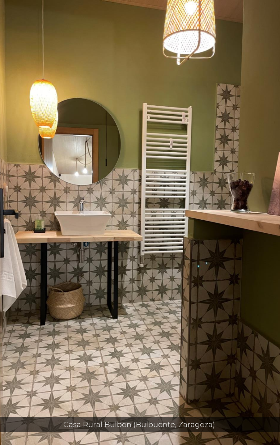
Casa Rural Bulbon (Bulbiente, Zaragoza)