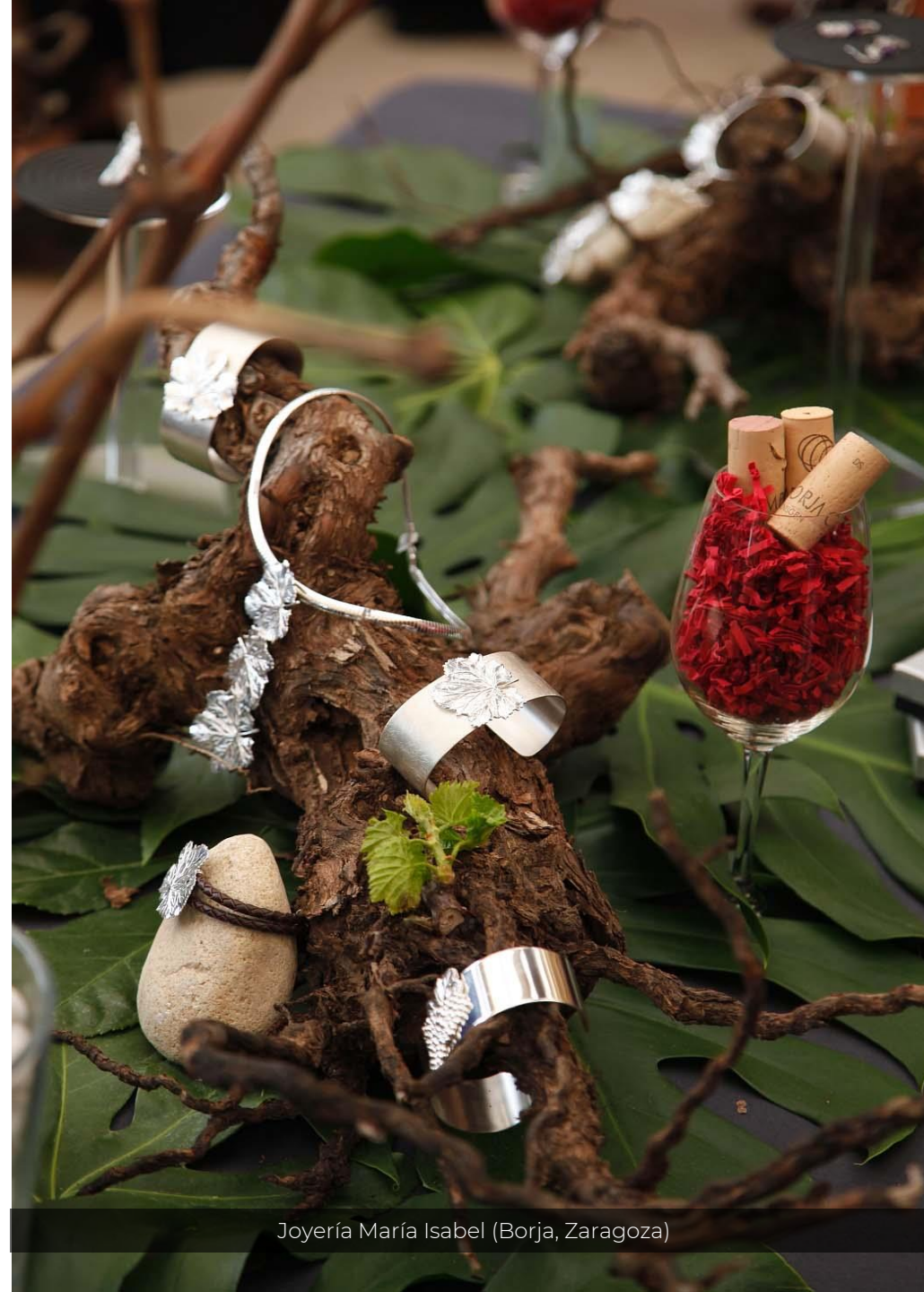
Joyería María Isabel (Borja, Zaragoza)