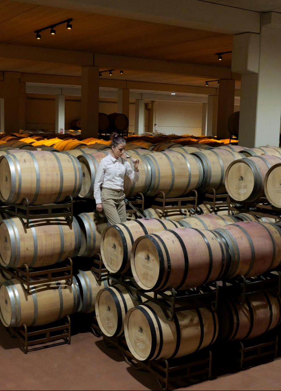
Bodegas Aragonesas (Fuendejalón, Zaragoza)